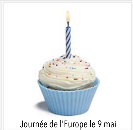
Journée de l'Europe le 9 mai

La liste des chants traditionnels et actuels Européens diffusés sera disponible auprès de Mme COLLAS sur simple demande lors de cette journée de rentrée en musique.