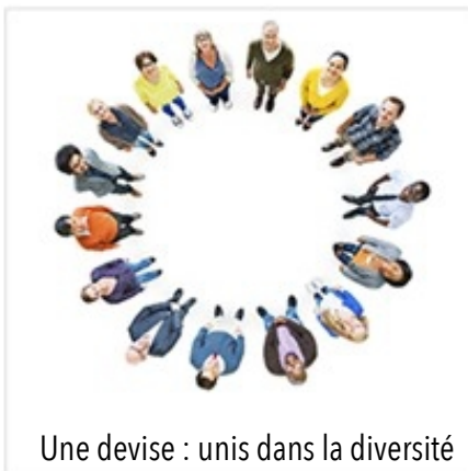
Une devise : unis dans la diversité